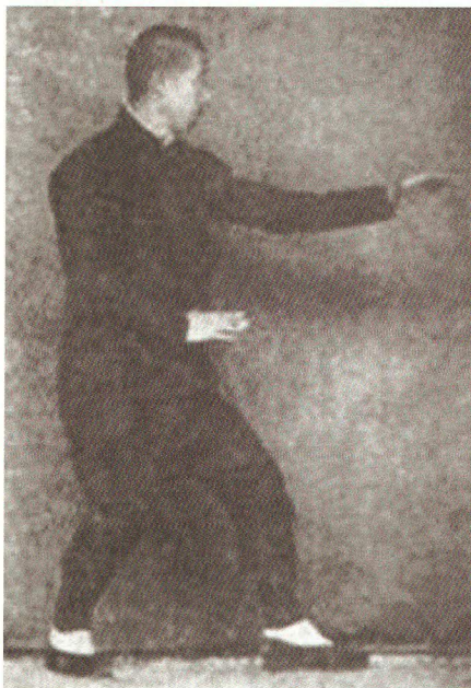
SUN LUTANG SANTI POSITIE